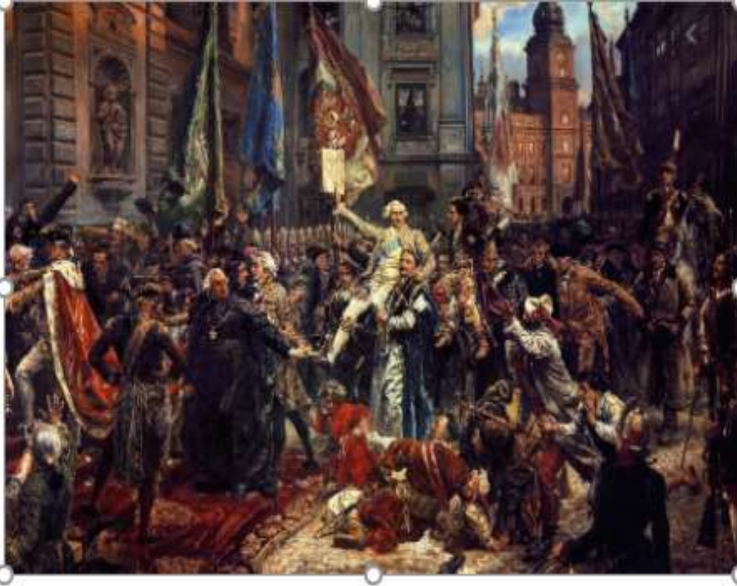
Fragment obrazu Jana Matejki „Konstytucja 3 Maja 1791 roku”

Konstytucja Rzeczypospolitej Polskiej to bardzo ważny dokument, który określa funkcje najważniejszych władz państwa, a także prawa i obowiązki obywateli.