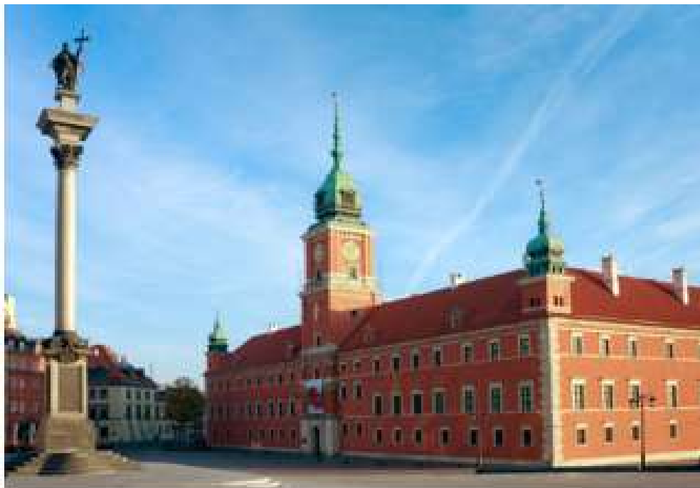
Zamek Królewski w Warszawie i kolumna Zygmunta

Najważniejszym miejscem w kraju jest jego stolica. Kiedyś stolicą Polski było Gniezno a potem Kraków.