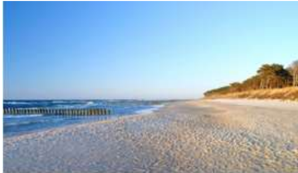
Piękne piaszczyste plaże